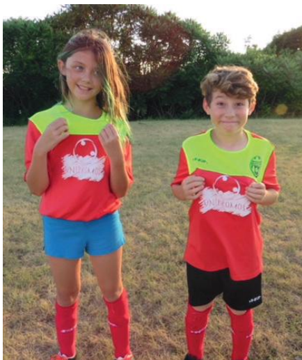
Con il Toronto Azzurri Soccer Club (Canada, 2017)